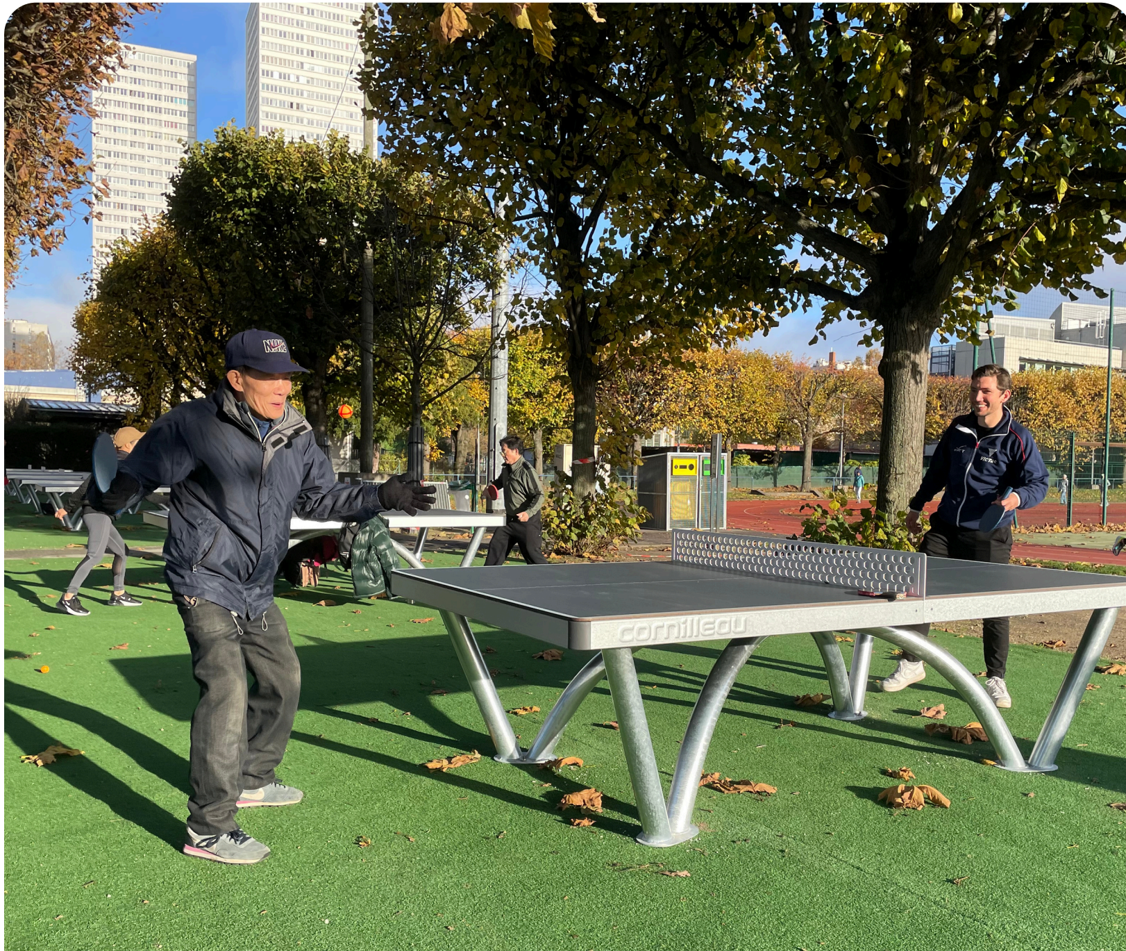
Site de 8 tables dans l'espace sportif Carpentier (Paris XIII)