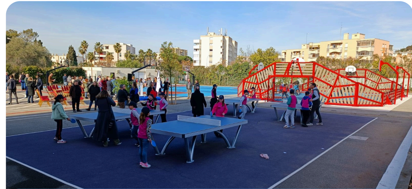
Espace 4 tables à Saint-Raphaël