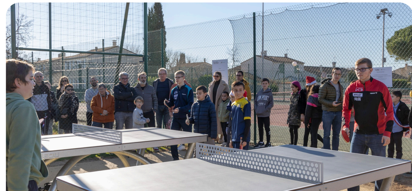
Espace 2 tables à Lansargues